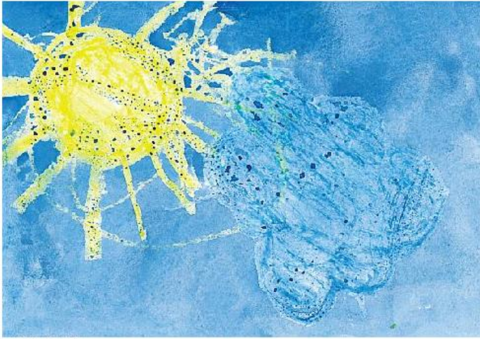
«СОЛНЫШКО» Полина Х. (2 года)