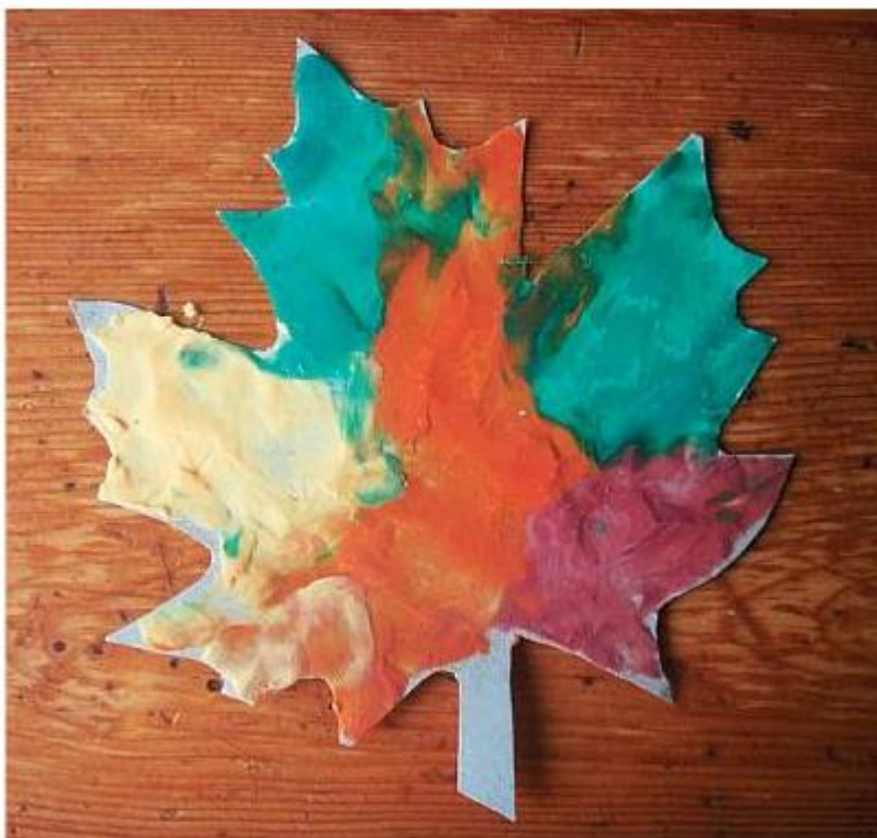
«ОСЕННИЕ ЛИСТЬЯ» Саша С. (1 год 6 мес.)