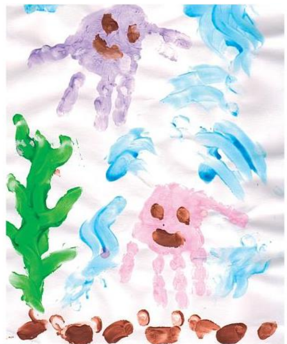
«ОСЬМИНОГИ» Никита С. (2 года)