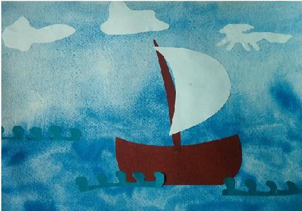
«ПАРУСНИК И БЕЛОГРИВЫЕ ЛОШАДКИ» Саша С. (2 года)