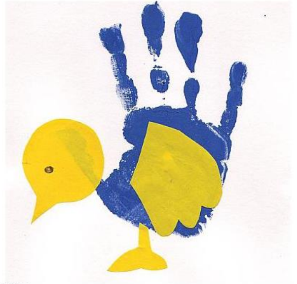
«ЦЫПЛЕНОК» Полина Х. (2 года)