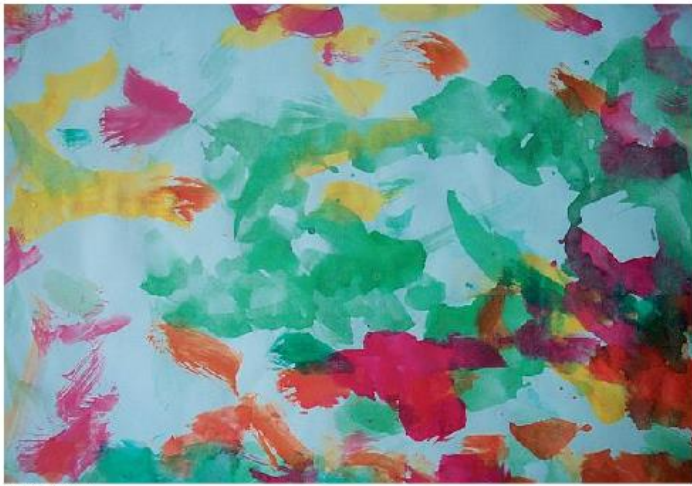
«ОГОРОД» Саша С. (2 года 2 мес.)