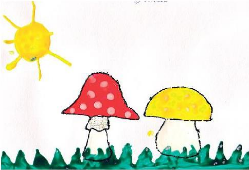
«ГРИБЫ» Маша С. (2 года 3 мес.)