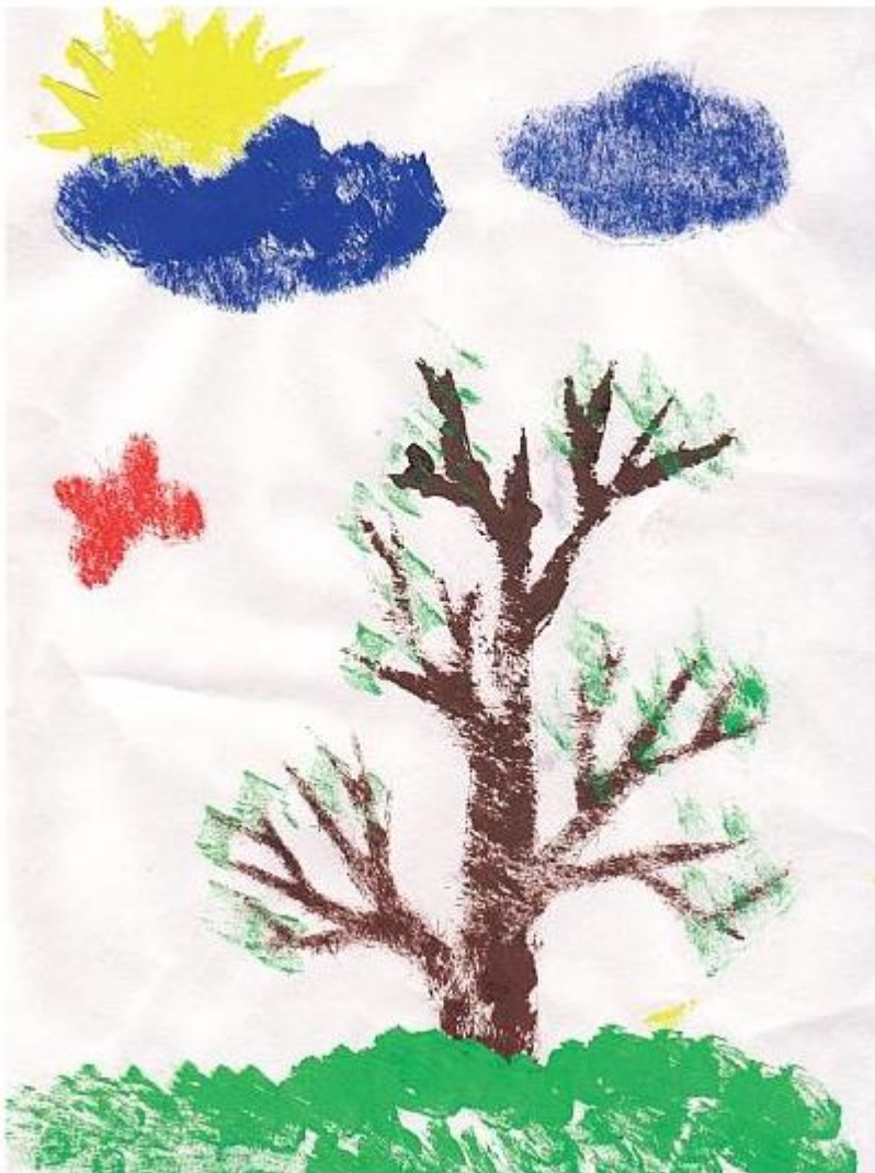
«ДЕРЕВО» Вова Д. (2 года 6 мес.)