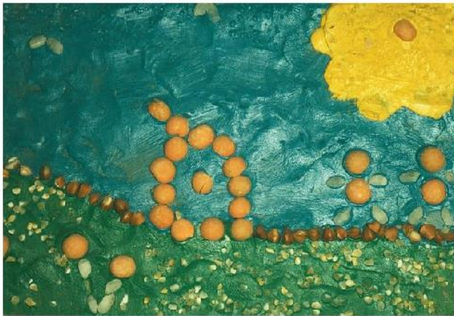
«ЛЕТО» Саша С. (1 год 2 мес.)