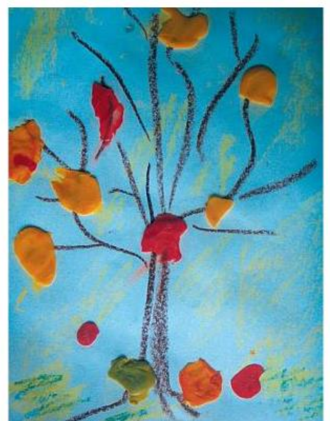
«ОСЕНЬ» Саша С. (3 года)