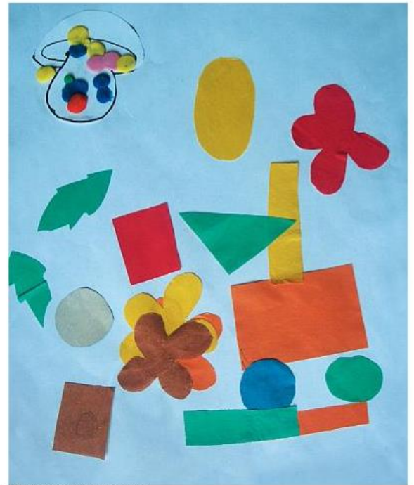
«ПАРОВОЗИК ИЗ РОМАШКОВА» Саша С. (2 года 4 мес.)